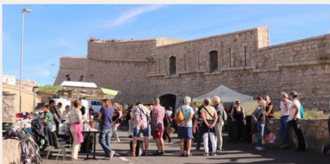
2ème édition Festival des ÉPIS - Sète (octobre 2024)

Dégustation de produits locaux, animations interactives pour échanger sur les activités des Épis et bénéficier de retours d'expériences, des ateliers d'échange autour de l'alimentation, le lien social... une ambiance festive et conviviale tout au long de l'évènement !