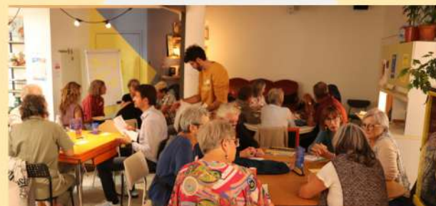
2ème édition Festival des ÉPIS - Sète (octobre 2024)

L'association est organisée en groupes de travail thématisés permettant à ses différents membres adhérents de contribuer aux cercles de réflexion et d'actions qui les animent le plus et ainsi de s'engager concrètement auprès du Mouvement des ÉPIS.