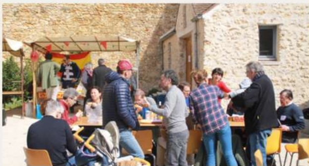
1ère édition Festival des ÉPIS - Chateaufort (avril 2019)

100 participants 25 ÉPIS représentés de toute la France