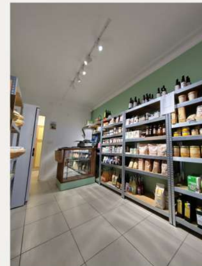
Épi de Liverdun

Ainsi, l'objectif est d'identifier les facteurs pouvant influencer positivement ou négativement l'action des épiceries.