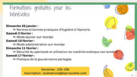
Visuel de communication pour les journées Formations de l'Éprouvette (22 - Côtes d'Armor)

Les participants étaient invités à venir avec leurs ordinateurs pour réaliser divers cas concrets et pratiques. Bilan de ces formations : des épiciers plus ou moins débutants rassurés et plus à l'aise avec la plateforme !