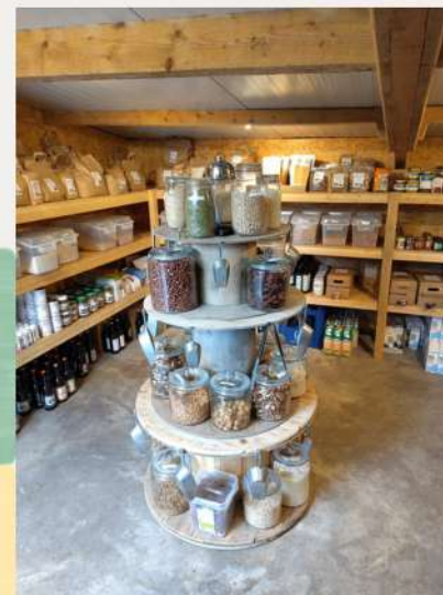
Épi du bocage